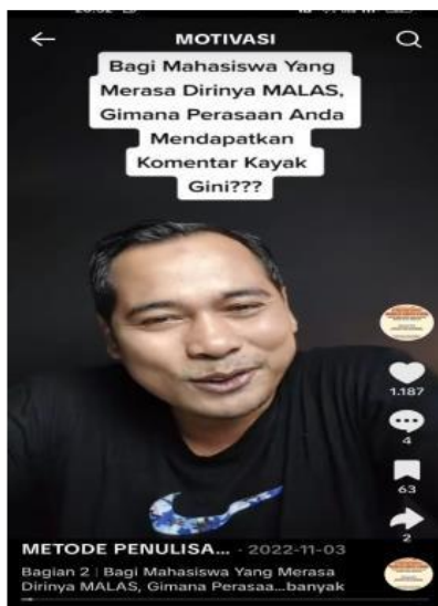
Gambar 6. Bagi Mahasiswa yang Merasa Dirinya Malas, Gimana Perasaan Anda Mendapatkan Komentar Kayak Gini

Dalam menyelesaikan tugas akhir, mahasiswa sering mengalami penurunan motivasi yang ditandai dengan munculnya rasa malas dan penundaan pekerjaan akademik.