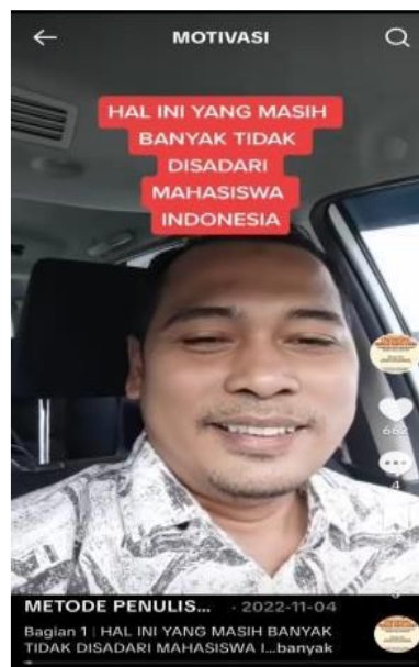
Gambar 5. Hal Ini yang Masih Banyak Tidak Disadari Mahasiswa Indonesia

Dalam proses perkuliahan, tidak sedikit mahasiswa yang menjalani aktivitas akademik tanpa menyadari tanggung jawab terhadap proses pembelajaran yang sedang dijalani.