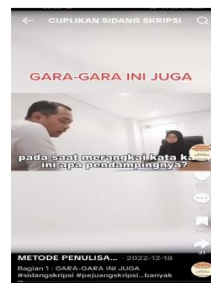
Gambar 3. Anti dengan Skripsi Plagiasi, Biarlah Sederhana Asalkan Buatan Sendiri

Dalam proses penyusunan tugas akhir, tekanan akademik serta keterbatasan waktu sering mendorong sebagian mahasiswa untuk memilih cara instan, salah satunya dengan melakukan plagiasi, padahal keaslian karya ilmiah merupakan prinsip dasar dalam etika akademik.