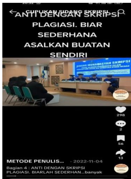
Gambar 4. Diuji Oleh Dosen Alumni Canada dan Malaysia, Mahasiswa Ini Tetap Mampu Bersuara

Sidang skripsi sering dipersepsikan sebagai momen yang menegangkan, terlebih ketika mahasiswa diuji oleh dosen dengan latar belakang akademik yang dianggap tinggi atau internasional. Kondisi ini dapat memengaruhi tingkat kepercayaan diri mahasiswa.