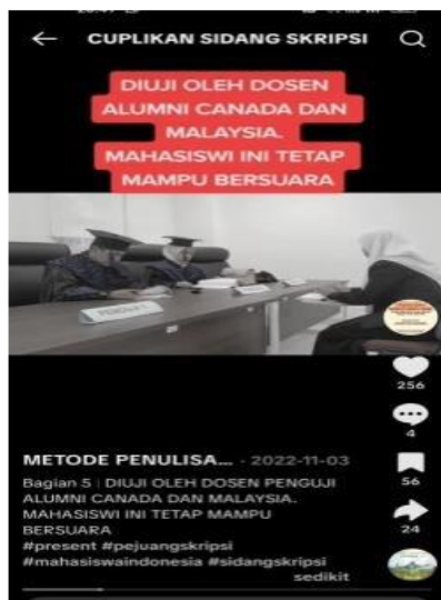
Gambar 2. Gara-Gara Ini Juga

Sidang skripsi merupakan tahap akhir dalam proses penyelesaian studi yang mengharuskan mahasiswa mampu mempertanggungjawabkan seluruh isi penelitian yang telah disusun.