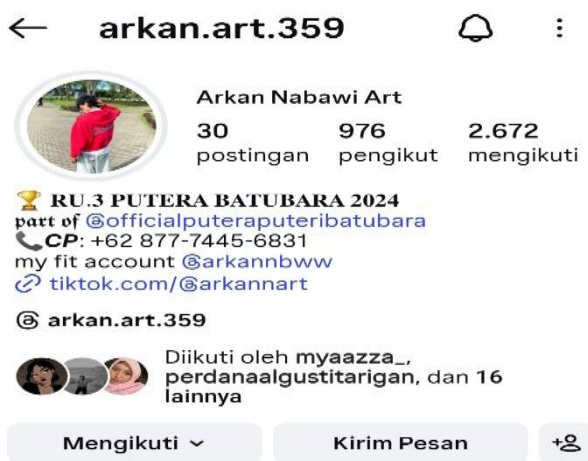
Gambar 4. Profil Media Sosial Instagram @arkan.art.359

Instagram didasarkan pada kemudahan penggunaan serta karakter visual yang memungkinkan ekspresi diri tanpa harus menyampaikan narasi panjang. Strategi yang digunakan untuk menjaga citra positif adalah dengan menghindari konten yang bersifat provokatif, mengandung konflik, atau terlalu personal. Dalam perspektif front stage dan back stage , informan menilai perbedaan antara keduanya tidak terlalu besar, namun tetap terdapat kontrol terhadap apa yang ditampilkan. Informan mengakui bahwa dalam kehidupan nyata ia dapat mengungkapkan emosi secara lebih bebas, sedangkan di Instagram ia cenderung menampilkan versi diri yang telah disaring. Citra yang ditampilkan dianggap cukup merepresentasikan dirinya, tetapi tetap merupakan hasil kurasi. Pengaruh terbesar berasal dari teman sebaya yang membentuk tren gaya posting dan jenis konten yang dianggap relevan.