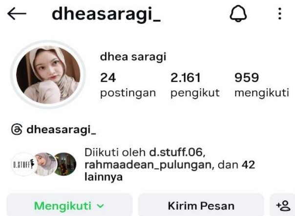
Gambar 5. Profil Media Sosial Instagram @dheasaragi_

Informan ketiga dengan nama pengguna @arkan.art.359 mulai menggunakan Instagram sejak tahun 2017. Berbeda dengan informan pertama, akun ini memiliki jumlah pengikut sekitar 976 orang yang didominasi oleh teman kampus dan teman dekat. Informan menggunakan Instagram terutama untuk mengungkapkan diri dan menjaga hubungan sosial dalam lingkaran pertemanan. Konten yang diunggah cenderung berkaitan dengan hobi dan aktivitas santai, seperti kegemarannya dalam berbusana dan modelling . Informan memaknai citra diri sebagai persepsi publik yang terbentuk dari interaksi simbolik di media sosial. Informan berusaha menampilkan citra sebagai pribadi yang santai, ramah, dan autentik. Pemilihan