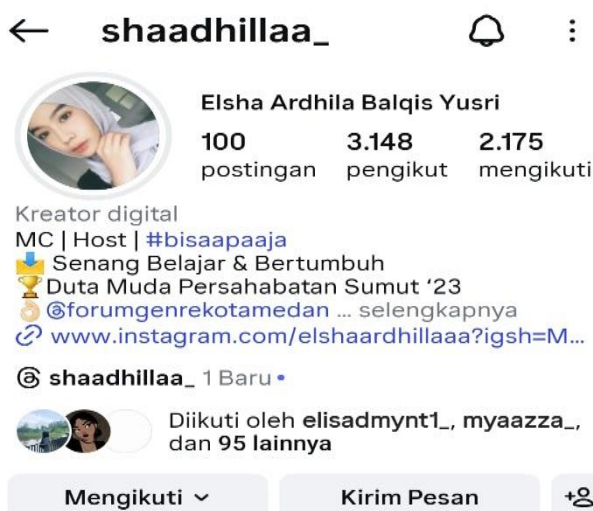
Gambar 2. Profil Media Sosial Instagram @shaadillaa_

Informan pertama dengan nama pengguna @shaadillaa_ telah menggunakan Instagram sejak tahun 2023 dan menjadi lebih aktif selama masa perkuliahan. Informan memiliki akun publik dengan jumlah pengikut sekitar 3.148 orang, yang terdiri atas teman, keluarga, serta relasi organisasi. Konten yang diunggah didominasi oleh foto diri, aktivitas kampus, serta konten dengan nilai estetika visual. Hal ini menunjukkan bahwa Instagram digunakan sebagai sarana representasi identitas sekaligus ekspresi personal. Menurut @shaadillaa_, citra diri adalah gambaran mengenai siapa dirinya yang ingin diketahui dan diakui oleh orang lain. Informan berupaya menampilkan citra sebagai perempuan yang percaya diri, mandiri, dan positif.