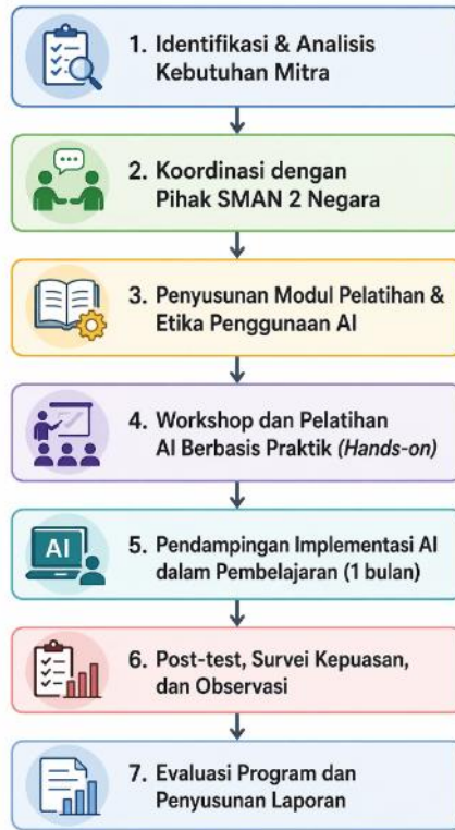
Gambar 1. Metode Pelaksanaan Pengabdian Masyarakat