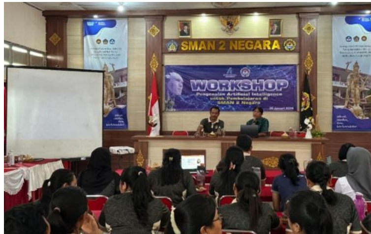
Gambar 2. Workshop dibuka Kepala Sekolah SMAN 2 Negara

Kegiatan pengabdian masyarakat di SMAN 2 Negara berhasil menjangkau seluruh guru yang menjadi target, yaitu 75 orang. Tingkat kehadiran mencapai 100%. Antusiasme peserta sangat tinggi, terlihat dari keaktifan dalam sesi tanya jawab (rata-rata 3 pertanyaan per sesi). Seluruh peserta (100%) menyatakan bahwa workshop ini bermanfaat dalam survei kepuasan.