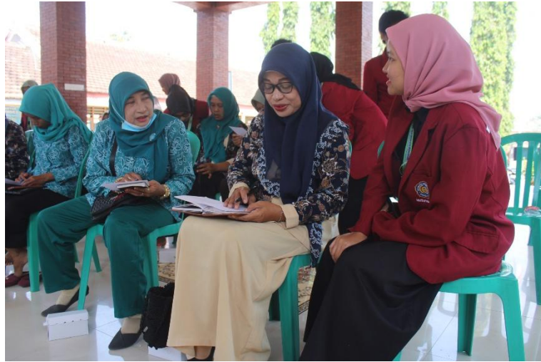
Gambar 6. Pelaksanaan Pelatihan Manajemen Pemasaran

Pada tahapan ini, mitra mengalami kesulitan terhadap beberapa hal, diantaranya adalah (i) 80% mengalami kesulitan dalam pemanfaatan fitur-fitur yang tersedia pada platform digital tersebut, karena selama ini handphone hanya sebatas memenuhi kebutuhan komunikasi semata, dan tidak untuk aktivitas ekonomi lainnya, (ii) 30% mengalami kendala akses internet yang kurang stabil dan biaya pembelian paket internet, yang dinilai masih terlalu mahal, dan (iii) 40% mengalami kesulitan untuk mempromosikan produk pada media yang tersedia.