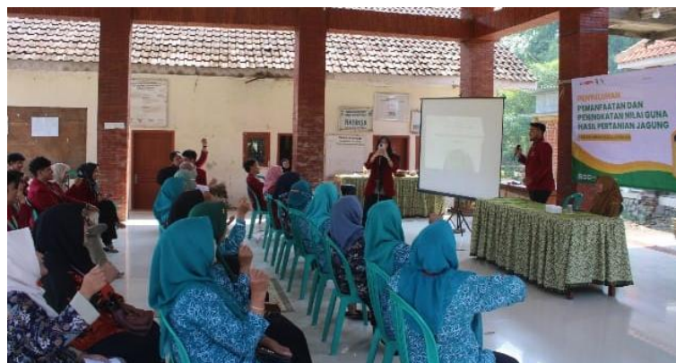
Gambar 4. Pelaksanaan Pemberdayaan Masyarakat Desa Bleberan, Kabupaten Mojokerto