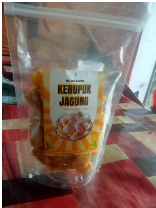
Gambar 7. Kemasan Produk Kerupuk Jagung

Pada tahapan ini, mitra mengalami kesulitan terhadap beberapa hal, diantaranya adalah (i) 80% mengalami kesulitan dalam pemanfaatan fitur-fitur yang tersedia pada platform digital tersebut, karena selama ini handphone hanya sebatas memenuhi kebutuhan komunikasi semata, dan tidak untuk aktivitas ekonomi lainnya, (ii) 30% mengalami kendala akses internet yang kurang stabil dan biaya pembelian paket internet, yang dinilai masih terlalu mahal, dan (iii) 40% mengalami kesulitan untuk mempromosikan produk pada media yang tersedia.