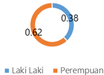
Gambar 2. Grafis hasil berdasarkan Jenis Kelamin

Berdasarkan grafik diatas, jumlah partisipan berjenis kelamin perempuan sejumlah 31 orang atau sekitar 62%, sedangkan sisanya adalah partisipan laki-laki sejumlah 19 partisipan. Partisipan yang hadir, memiliki latar belakang pekerjaan/aktivitas yang berbeda-beda, yaitu : kelompok tani, ibu-ibu rumah tangga (yang tergabung dalam PKK desa Bleberan), dan para penggerak Karang Taruna, dengan komposisi sebagai berikut (Gambar 3).