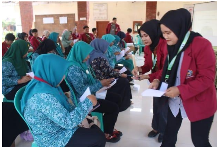
Gambar 5. Pelaksanaan Pelatihan Pencatatan dan Pembukuan Neraca Akuntansi Secara Sederhana

Dalam pelaksanaan bidang ini, mitra sasaran diberikan bekal pengetahuan sekaligus praktek berupa cara mudah melakukan pencatatan sederhana untuk memilah akun modal dan keuntungan yang akan diperoleh. Segala bentuk pengeluaran berupa pembelian alat dan bahan, akan tercatat sebagai komponen modal. Berdasarkan kalkulasi banyaknya produk krupuk jagung yang siap dipasarkan berjumlah 150 bungkus setiap satu kali olahan dengan takaran bahan di atas. Harga yang ditetapkan sebesar Rp 10.000 perbungkus, berdasarkan harga dan jumlah produk maka diperoleh pendapatan sebesar Rp 1.500.0000. Karena produksi ini masih dalam skala rumahan atau dikerjakan oleh rumat tangga sehingga untuk menghitung berdasarkan pengeluaran dari biaya- biaya yang langsung terjadi. Dalam kegiatan ini, total biaya peralatan adalah Rp 660.000 dan total biaya bahan sebesar Rp 175.000. Penghitungan penerimaan yang didapat dari pengolahan kerupuk jagung (150 biji) adalah Rp. 1.500.000. Dengan total biaya produksi sebesar Rp. 835.000 maka keuntungan yang didapatkan dalam 1 kali produksi jagung adalah Rp. 665.000.