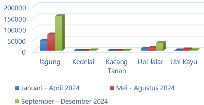
Gambar 1. Grafis hasil produksi palawija Kabupaten Mojokerto

Berdasarkan gambar 1 di atas dapat dilihat bahwa secara umum produksi jagung tahun 2024 merupakan yang tertinggi jika dibandingkan dengan komoditas palawija lain. Komoditi dengan produksi tertinggi kedua yaitu ubi jalar, kemudian disusul ubi kayu pada urutan ketiga, diurutkan keempat dan kelima adalah kacang tanah dan kedelai.