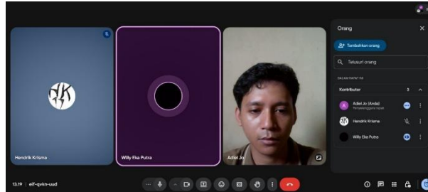
Gambar 1. Wawancara Bersama Owner Clico

memberikan arahan, dan mengevaluasi progres proyek. Menurut Owner, faktor yang paling menentukan efektivitas kerja sama tim adalah komunikasi terbuka dan motivasi anggota tim.