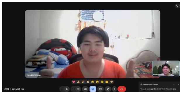
Gambar 2. Wawancara Bersama Desain Grafis Clico

Desain Grafis Clico menyampaikan dalam wawancara bahwa kerja sama tim berlangsung secara kolaboratif, terutama dengan fotografer dan videografer, untuk memastikan hasil desain sesuai dengan konsep yang telah disesuaikan dengan keinginan konsep. Alur komunikasi dilakukan melalui diskusi langsung secara daring, terutama untuk koordinasi teknis. Tantangan yang sering muncul dalam kerja sama tim adalah perbedaan persepsi terhadap konsep, dan kehabisan ide yang kadang memerlukan beberapa kali revisi. Tahap kolaborasi yang paling penting adalah saat menerjemahkan brief dari klien menjadi desain visual, karena kualitas desain sangat dipengaruhi oleh kerja sama tim.