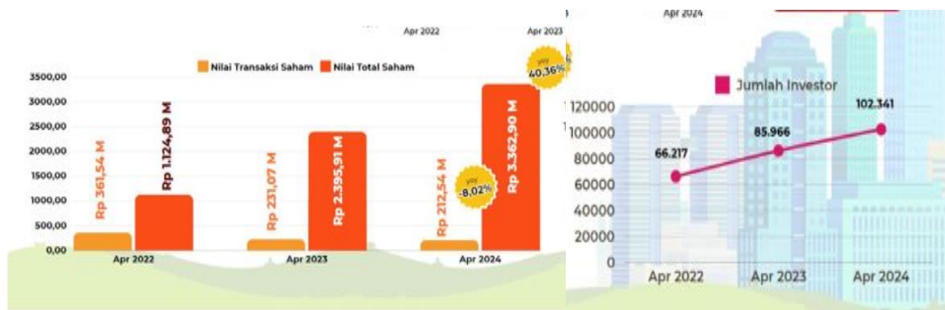
Gambar 1. Data Perkembangan Pasar Modal Kalimantan Tengah tahun 2022-2024

Secara nasional, Kalimantan Tengah menempati peringkat ke-23 dari total 38 provinsi dalam jumlah investor pasar modal. Kondisi ini mengindikasikan adanya kecenderungan pertumbuhan minat investasi masyarakat yang semakin membaik. Hal tersebut terlihat dari peningkatan investor saham per April 2024 meningkat 19,05% (16.375 investor) secara tahunan ( year on year ), dari 85.966 investor pada April 2023 menjadi 102.241 investor pada April 2024 (Antaraneews.com, 2024). Selain itu, nilai total kepemilikan saham mengalami kenaikan 40,36% (Rp966,99 miliar) dari Rp2.395,91 miliar menjadi Rp3.362,90 miliar. Meskipun demikian, nilai transaksi saham secara nominal pada April 2024 tercatat menurun 8,02% (Rp18,53 miliar), dari Rp231,07 miliar menjadi Rp212,54 miliar. Profesi investor di Kalimantan Tengah cukup beragam, sebanyak 35,46% berprofesi sebagai: pegawai negeri maupun swasta, termasuk guru. Kota Palangka Raya sebagai kota yang sedang bertumbuh dengan masyarakat yang memiliki berberbagai profesi, dan tercatat sebagai urutan pertama yang memiliki jumlah investor tertinggi di Kalimantan Tengah dibandingkan Kabupaten lainnya: Kotawaringin Timur; Kotawaringin Barat; Kapuas; Barito (balanganews.com, 2025), dengan jumlah investor sebesar 27.953 (21,45%) dari jumlah investor pasar modal di Kalimantan Tengah sebesar 130.295 investor. Upaya peningkatan literasi keuangan telah dilakukan oleh Otoritas Jasa Keuangan melalui berbagai program edukasi.