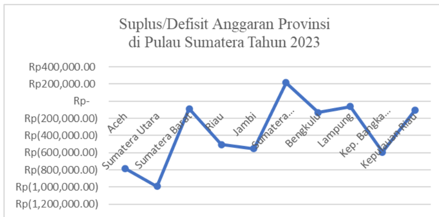
Gambar 1. Surplus/Defisit Anggaran Provinsi di Pulau Sumatera Tahun 2023

Pulau Sumatera, sebagai pulau terbesar ketiga di Indonesia, memiliki kekayaan alam yang melimpah serta keanekaragaman budaya yang unik di setiap provinsinya. Dalam konteks otonomi daerah, provinsi di pulau Sumatera menyelenggarakan otonomi daerah sesuai perundang-undangan yang berlaku. Provinsi di pulau Sumatera memanfaatkan dan mengembangkan potensi unggulan masing-masing. Beberapa provinsi yang kaya sumber daya seperti Riau dan Sumatera Selatan mungkin lebih mampu mengatasi Fiscal Stress dibandingkan daerah yang memiliki keterbatasan sumber daya, seperti Bengkulu atau Kepulauan Riau. Oleh karena itu, kebijakan otonomi daerah harus diimbangi dengan strategi peningkatan kapasitas fiskal agar Fiscal Stress dapat diminimalisir dan pembangunan daerah berjalan optimal. Daerah yang memiliki kapasitas fiskal rendah karena tidak tersedia sumber daya yang dapat diolah menjadi pendapatan asli daerah, maka kemampuan fiskal untuk menutup belanja menurun, sehingga kesenjangan pendapatan dan pengeluaran meningkat sehingga menimbulkan Fiscal Stress . (Citra, 2024). Defisit anggaran merupakan penyebab terjadinya Fiscal Stress dimana mencerminkan pengeluaran belanja lebih besar daripada pendapatan. Apabila belanja daerah melebihi dari pendapatan daerah, maka daerah tersebut harus mencari pendanaan tambahan, seperti utang daerah atau penggunaan dana cadangan, yang dapat meningkatkan beban fiskal di masa depan. Tersaji pada gambar 1 data surplus/defisit anggaran LRA pada tahun 2023.