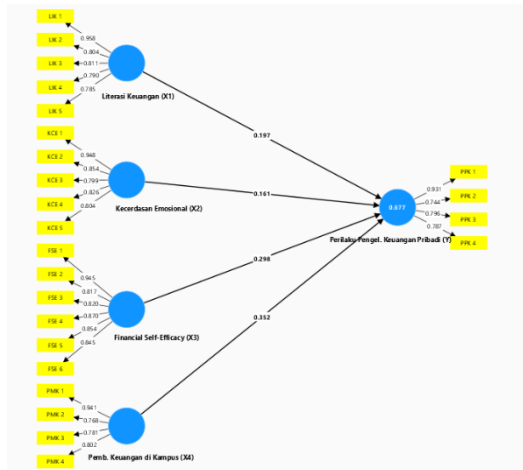
Gambar 2. Skema outer model PLS

Dengan menggunakan SmartPLS 4.0 , peneliti dapat mengestimasi model berdasarkan hubungan-hubungan tersebut serta menguji validitas dan reliabilitas konstruk yang ada. Hasil pengujian ini akan divisualisasikan dalam bentuk skema outer model , seperti yang ditampilkan di bawah ini.